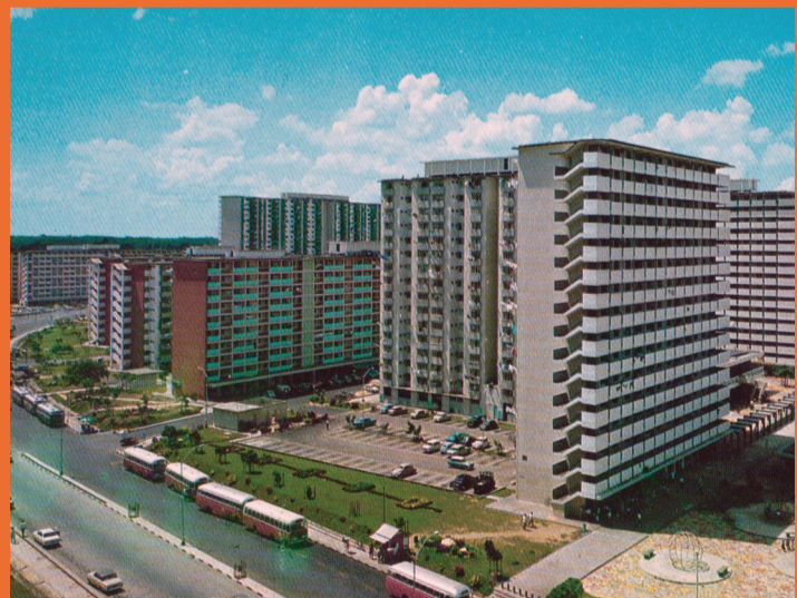
1960年代，印上大巴窑卫星镇的彩色明信片