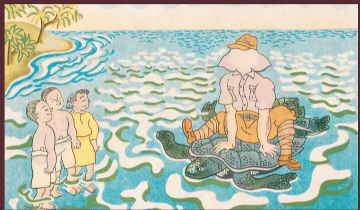
1940年代，日据时期印制的明信片