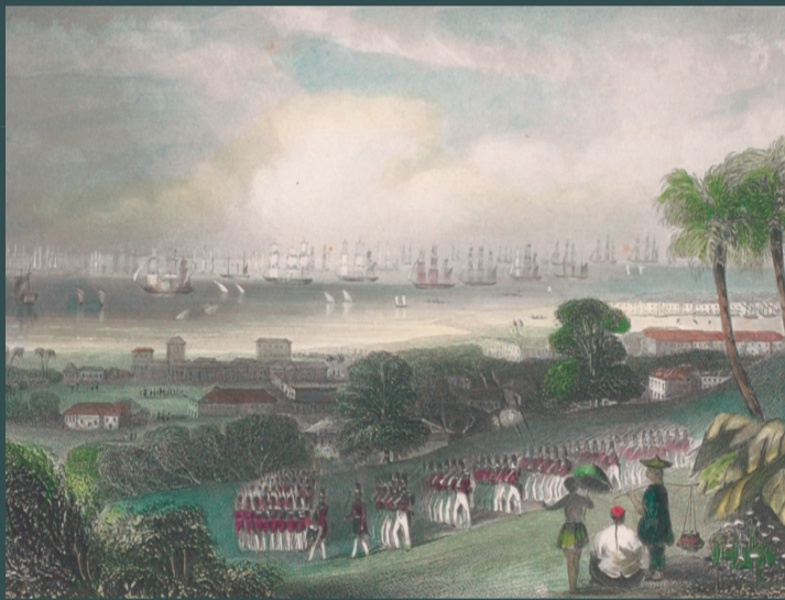
图示1830年东印度公司的守备军列队走下皇家山(Government Hill)